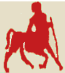
ΠΑΝΕΠΙΣΤΗΜΙΟ ΘΕΣΣΑΛΙΑΣ ΙΑΤΡΙΚΗ ΣΧΟΛΗ