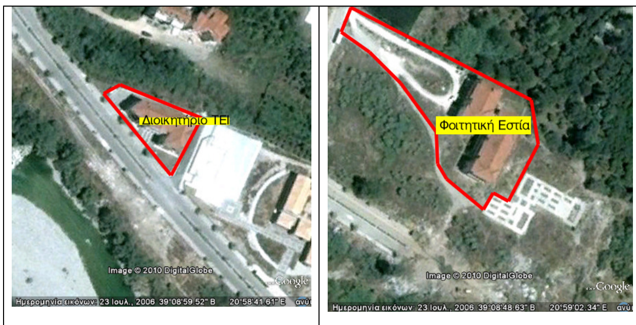
Διοικητήριο ΤΕΙ (αριστερά) και Φοιτητική Εστία (δεξιά)